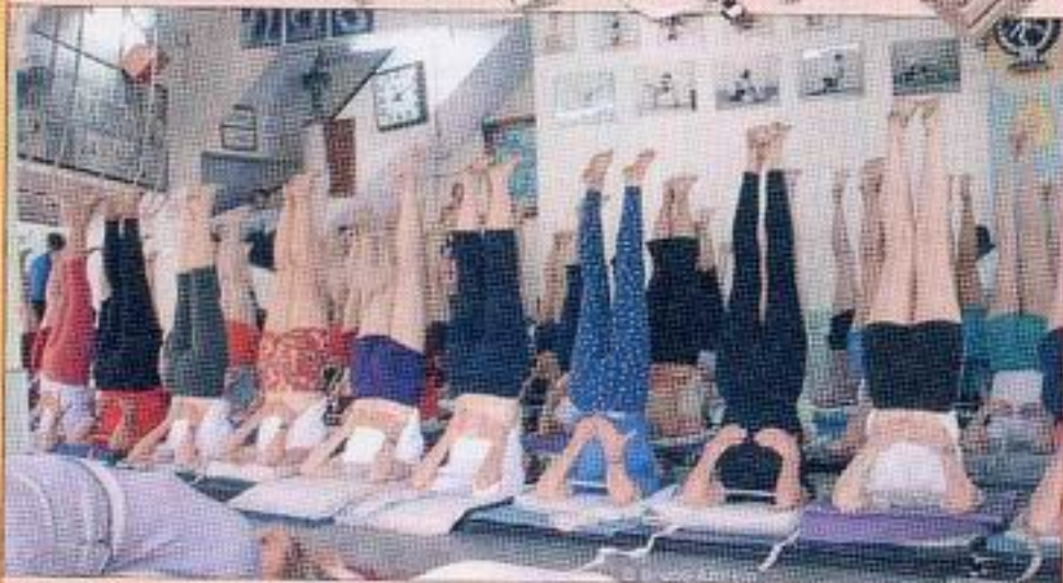
Allievi durante una lezione al centro. Sopra, i supporti previsti dal metodo.

sempre adornata con fiori freschi e di fronte alla quale Guruji, i figli, e gran parte degli studenti si inchinano appena varcano la soglia; non c'è lezione che inizi senza la recitazione dell'Om e l'invocazione in sanscrito allo stesso Patanjali.