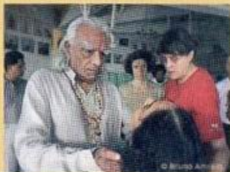
Iyengar all'Istituto durante una classe terapeutica.

Ma, inutile dirlo, vale assolutamente la pena affrontare sia l'attesa che l'affollamento nelle classi: il livello delle lezioni infatti è, comprensibilmente, altissimo. Senza contare che non c'è studente di questo metodo che non desideri avere la possibilità e la fortuna di poter osservare da vicino ogni mattina Guruji (come viene chiamato con devozione Iyengar) durante la sua pratica personale e poter così percepire la sua incredibile energia. Un'occasione davvero unica perché, nonostante tutti gli anni di esperienza e la profonda conoscenza e saggezza già acquisite, il Maestro a 87 anni continua a lavorare con passione e dedizione per far evolvere il suo metodo, sperimentando quotidianamente su se stesso. E già questo è un grandissimo insegnamento per non correre il rischio di considerarsi "arrivati" nello yoga. E anche per non usare mai l'età come pretesto per smettere di impegnarsi nella pratica. Pur avendo smesso di condurre