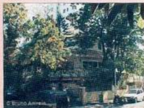
Nella foto, l'edificio ottagonale dell'Istituto.

Pune si trova sotto Mumbai nello stato del Maharashtra ed è una città con un forte sviluppo industriale dovuto soprattutto alla produzione di software. Si tratta, insomma, di un posto dotato di molti confort occidentali come centri commerciali, sportelli bancomat, librerie internazionali e farmacie. Frequentata da molti studenti per la sua prestigiosa Università, non manca mai una massiccia presenza di occidentali in parte diretti al Ramamani Iyengar Memorial Yoga Institute e in parte al famosissimo Osho Commune International. Da non perdere la visita al Tempio di Pataleshvara (Jangali Maharaj Rd) interamente scavato nella pietra e risalente al VIII sec. E per un weekend rilassante fuori città si consiglia la Kare Ayurvedic Retreat di Mulshi di fronte al lago Mulshi, un centro ayurvedico con la possibilità di praticare yoga secondo il metodo Iyengar (info.: tel. 0091-9850569044).