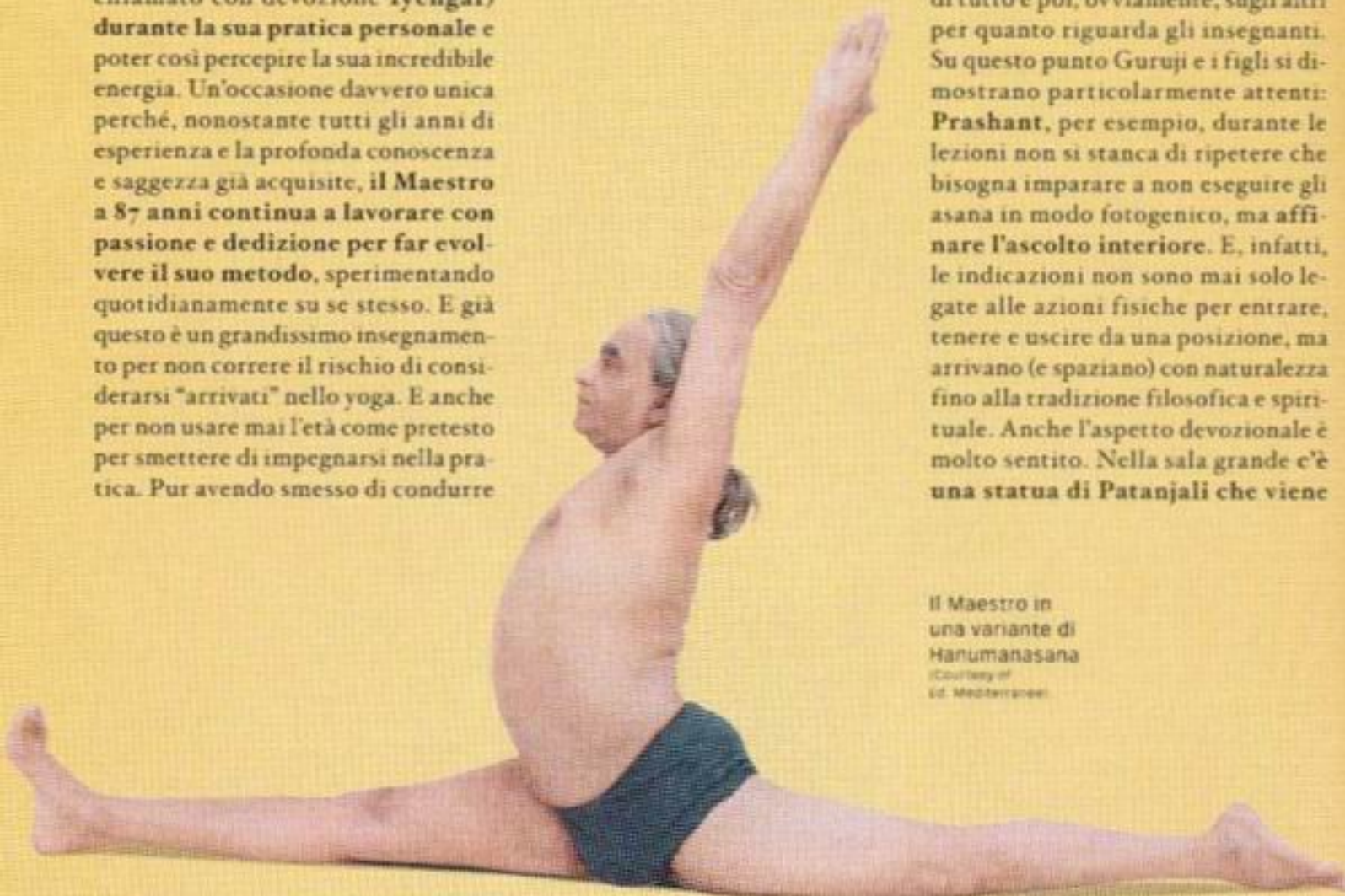
Il Maestro in una variante di Hanumanasana

Perché se a un osservatore esterno il metodo messo a punto da B.K.S. Iyengar può apparire eccessivamente dinamico e perfino marziale, bisogna dire che qui si insiste molto sullo sviluppo dell'intelligenza e della sensibilità del corpo per riuscire a incrementare la capacità di osservazione e riflessione, su se stessi prima di tutto e poi, ovviamente, sugli altri per quanto riguarda gli insegnanti. Su questo punto Guruji e i figli si dimostrano particolarmente attenti: Prashant, per esempio, durante le lezioni non si stanca di ripetere che bisogna imparare a non eseguire gli asana in modo fotogenico, ma affinare l'ascolto interiore. E, infatti, le indicazioni non sono mai solo legate alle azioni fisiche per entrare, tenere e uscire da una posizione, ma arrivano (e spaziano) con naturalezza fino alla tradizione filosofica e spirituale. Anche l'aspetto devozionale è molto sentito. Nella sala grande c'è una statua di Patanjali che viene